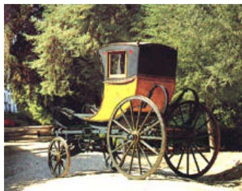
Sege – Colecção da Margalha