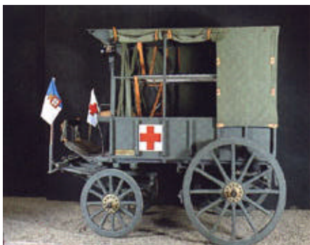
Ambulância