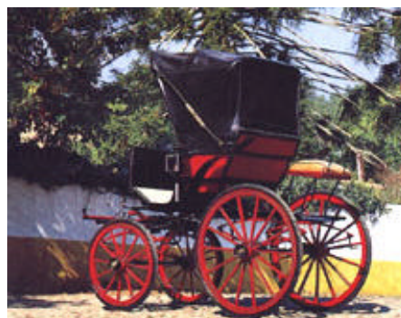
Spider Phaetom – Colecção da Margalha